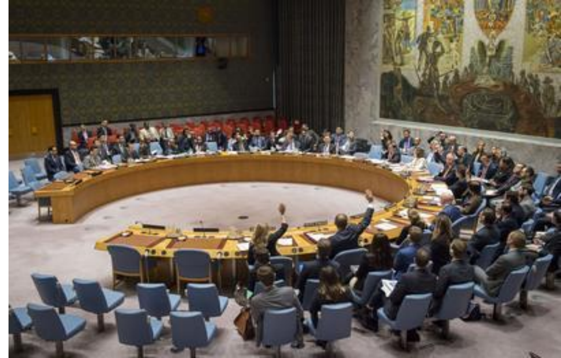
UN Photo/Loey Felipe

Recuperado el 07 de marzo de 2018 en: https://outreach.un.org/mun/content/drafting-resolutions